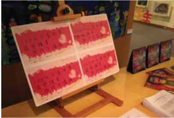
圖9 中部肯納藝術展座談-入口簽到處