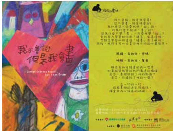
圖5 中部肯納藝術展畫展文宣