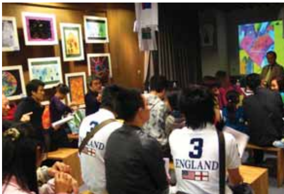
圖11 中部肯納藝術展座談-會場一角