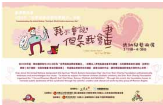
圖2 肯納藝術展場海報

肯納症，同時每94位男孩中就有1位男孩患有肯納症。「肯納症」（Kanner's Syndrome），也就是一般俗稱的「自閉症」。自2008年起，聯合國將每年的4月2日定訂為「世界提高自閉症意識日」，用以喚醒所有的地球人一同關注肯納症在全球日趨增加的現象。