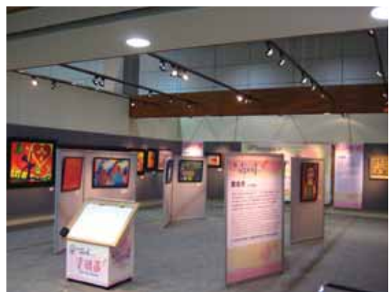
圖3 臺灣桃園國際機場第二航廈出境大廳C3登機門旁文化藝廊