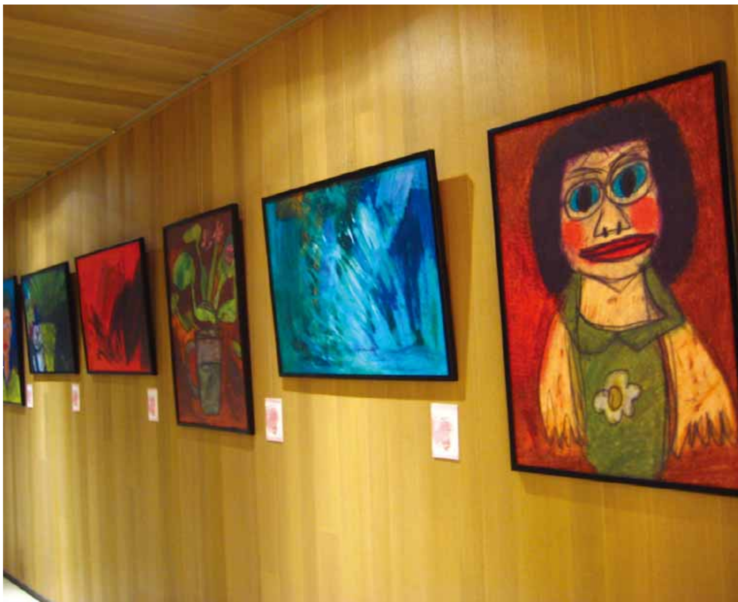
圖8 中部肯納藝術展走廊