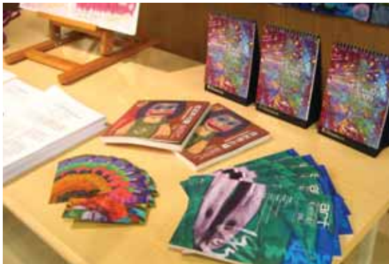
圖10 中部肯納藝術展座談-展示相關資料