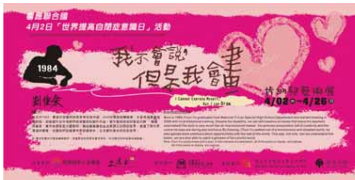
圖6 中部肯納藝術展畫展海報