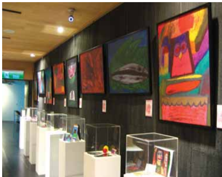
圖7 中部肯納藝術展展場會場