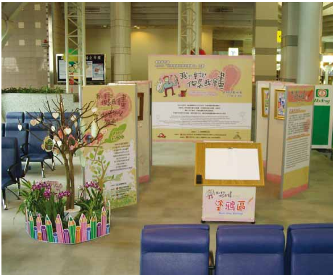
圖4 臺灣高雄國際機場出境大廳東、西區