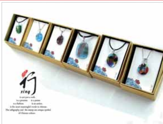
圖H 「琉行」精美琉璃項鍊

「行杯」；如下表B圖所示，可以印上照片成為拜訪親友的好贈禮。在金工媒材製作的「行」創意作品方面，有客製化雷射雕刻不鏽鋼項鍊；如下表C圖所示，以及精美的古銅色台灣島型鑰匙圈；如下表D圖所示，和銀銅製的可愛健走小花圖形的手機吊飾及徽章；如下表E圖所示。在這些硬質素材作品之中，有一樣特別採用軟性填充材質來表現，也就是「行人」的背包吊飾及鑰匙圈；如下表F圖所示，此設計是採用50-60年代國小教科書裡的復古人形圖案當做商品的創意點，讓使用者在使用時能夠與當年的古早味記憶相呼應。最後的琉璃素材作品當中，如下表G圖所示作品是將雙人並肩而行的圖像以簡化手法及藝術家個人靈思所轉換而成的純觀賞精美藝術品，最後下表H圖所示作品則為一系列的琉璃項鍊。其它創意紀念品也少不了將「行」字應用在衣服與帽子、及「百萬聚樂步」推廣中心本身所開發的趣味計步器與計時器上面；商品樣式如下表H~M圖所示。