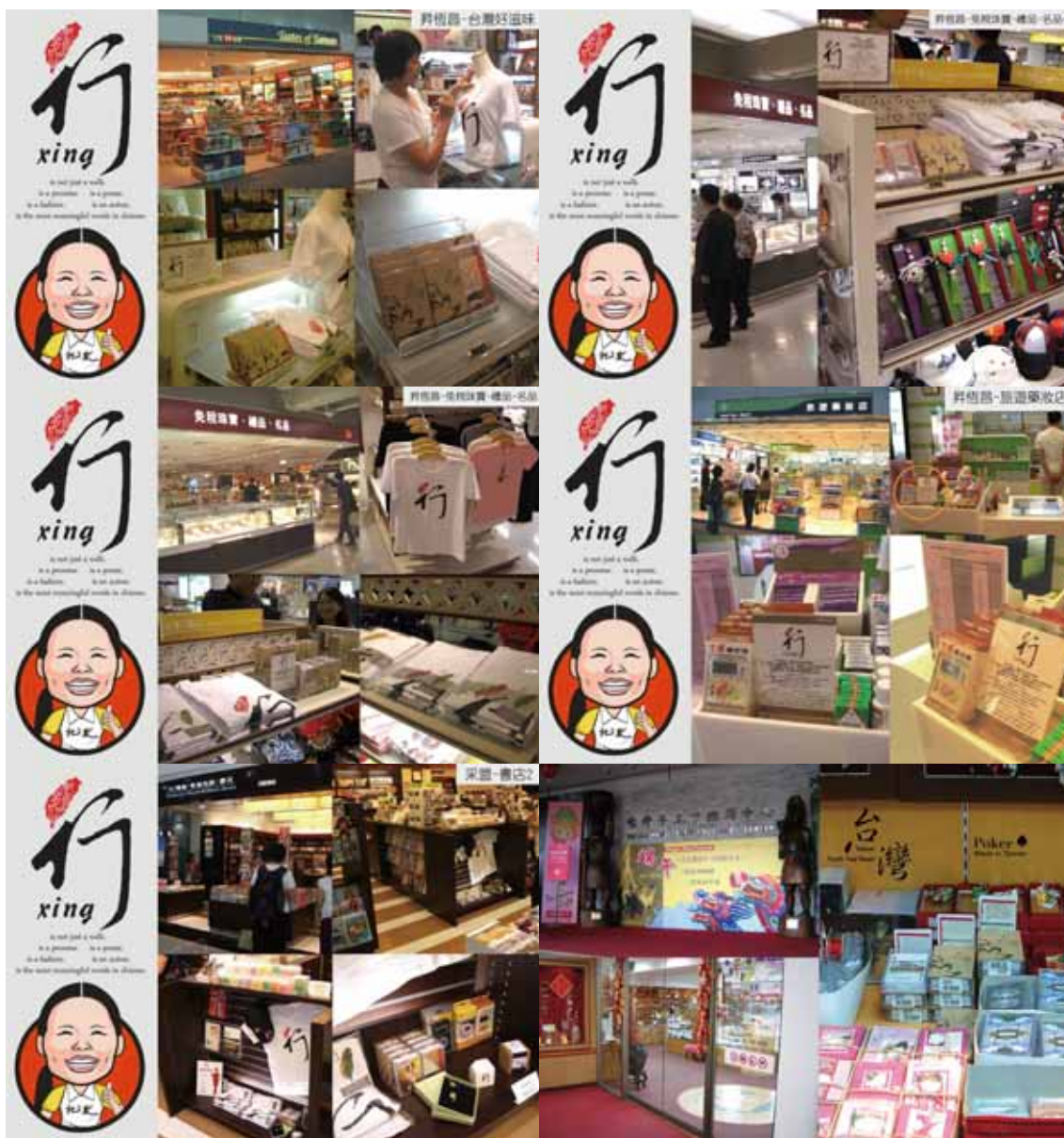
圖N 桃園中正機場第二航廈免稅店及台灣手工業推廣中心「行」系列主題商品賣點