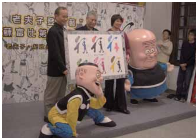
「行·為藝術」活動現場照