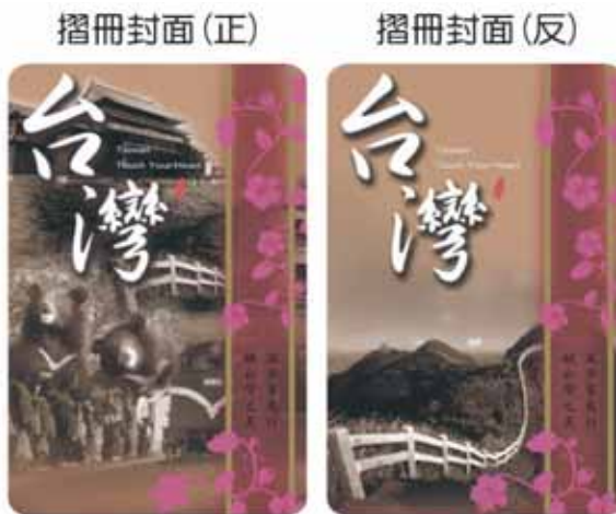
「行」的轉換商品…「台灣靚牌」