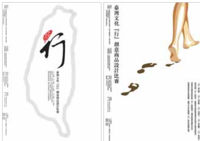
「台灣行」創意設計競賽海報

再另一場的「行·為藝術」活動推廣上，台灣藝術大學、希望基金會、及老夫子哈媒體，三方合力以「行」與老夫子可愛圖象做結合，完成一次成功的異業合作共同推廣活動，讓喜愛紀政女士及老夫子逗趣形象的亞洲華人能夠注意到「行」這個字。