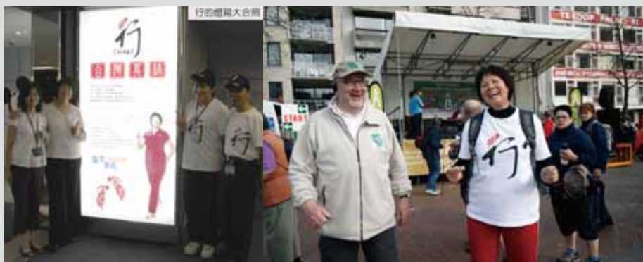
「行」的推廣曝光活動