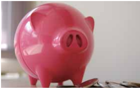
圖8 Unavoidable Evil