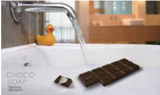
圖6 Choco Soap