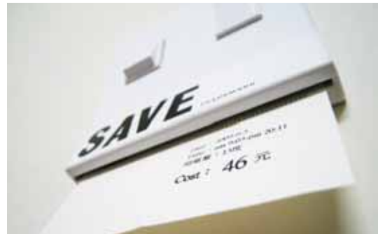
圖11 看不見的錢在流失