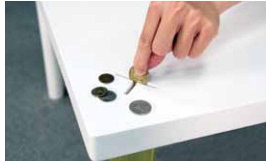
圖7 + desk