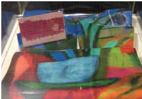
圖6 一摺一畫 (1)