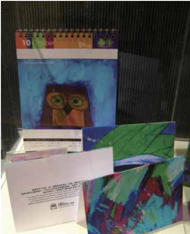
圖2 How Much I Love You ? 卡片

由精工打造的一把心型鑰匙項鍊，及手戒，其獨特外型是一特點，具象徵著肯納兒也象徵我們，我們期待進入肯納兒的內心，窺探與眾不同的世界，也開啟我們的心胸。他們（肯納兒）內心與外在的溝通管道並不如一般人那樣，簡單的言語表情卻可表達出直接的感受，而是透過其他不同的符碼去解讀，