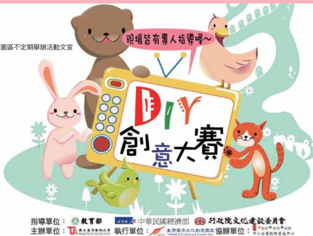
圖1 園區不定期舉辦活動文宣

為了回饋社區，與台北縣政府共創雙贏局面，本校特別配合北縣文化局所創辦的板橋市假日文化公車，提供校園藝術博物館以及文創園區各工坊，與「林家花園」、「435藝文特區」連成一條觀光路線（如圖1），讓民眾在假日可以搭乘專車到板橋幾個重要的藝術文化景點，從事一日遊的觀光活動。觀光巴士頭班車，將於週末週日早上九點鐘從台灣優浮文化創意園區發車，沿途停靠台灣藝術大學藝術博物館、林家花園、捷運府中站、板橋站、435藝文特區，民眾可購買一日遊票券100元，當天不限搭乘次數，並享有門票、購物優惠。