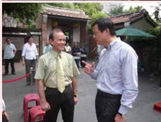
2 3 圖2 記者會台北縣周錫瑋縣長致詞 圖5 文化觀光巴士揭幕儀式(2) 4 5 圖3 記者會台藝大黃光男校長致詞 圖6 四巨頭促銷首航紀念卡 6 7 圖4 文化觀光巴士揭幕儀式(1) 圖7 設計學院林榮泰院長與周縣長交換園區經營理念