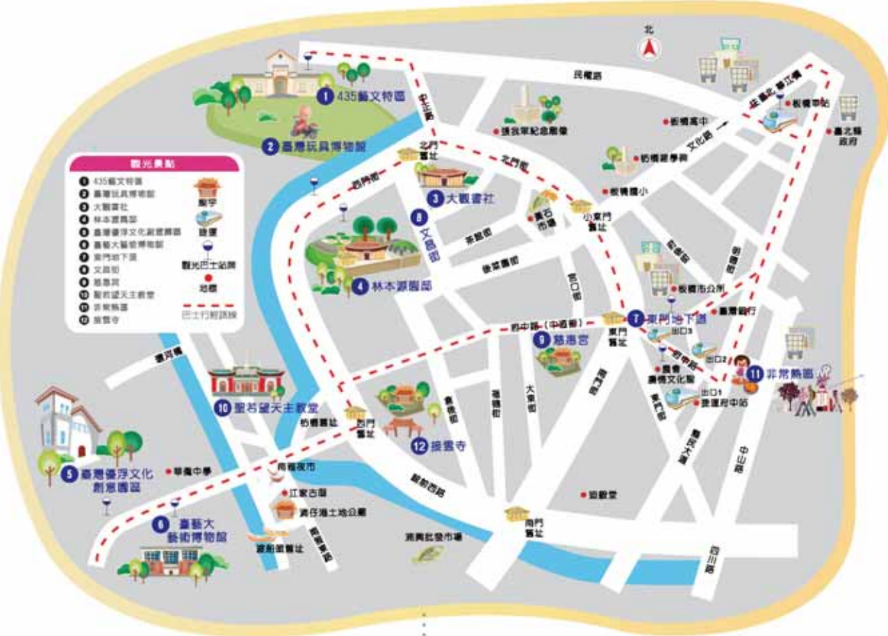
圖1 板橋假日文化公車路線圖