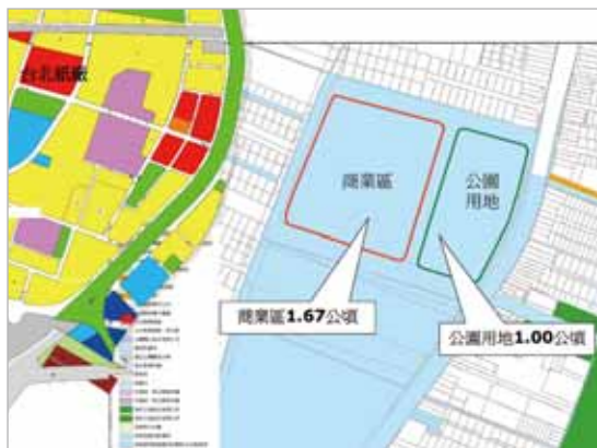
圖4 台北紙廠未來的都市計畫