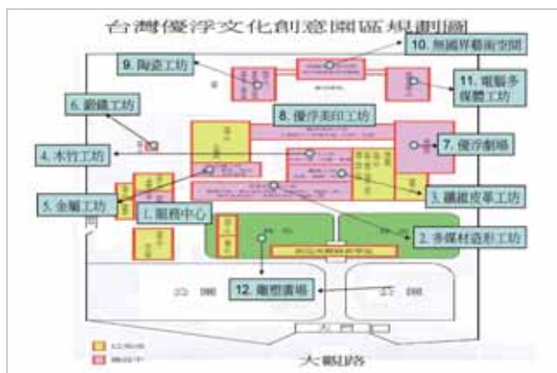
圖5 優浮文化创意園區未來規畫示意圖

未來紙廠將以「藝術產學」型態經營，打造紙廠成為一個具地方特色的文化创意產學園區，與前述的台藝美學在行銷上進行品牌連結。藉由文化创意產學園區的遼闊空間與展售平台，加上鄰近的林家花園與「四三五藝文特區」等知名景點，可以吸引假日觀光人潮，開創商機，讓文化创意產學園區