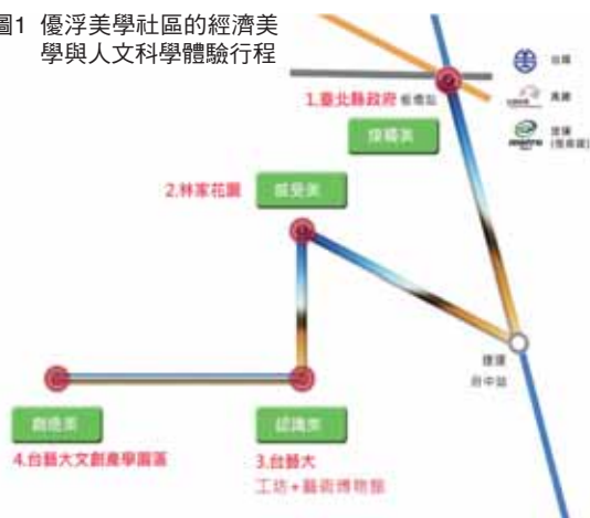
圖1 優浮美學社區的經濟美學與人文科學體驗行程