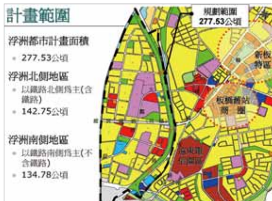
圖3 浮洲都市計畫範圍

台北紙廠也就是目前台藝大的文化創意園區，佔地3.9公頃，原隸屬行政院退輔會，該廠自民國八十八年撤廠以來，整片土地房舍閒置荒蕪多年，不僅浪費國家資源，且嚴重破壞都市景觀與治安，影響地方建設發展。在地方輿情的反映下，經與行政院退輔會及財政部國產局多次洽商後，國產局於