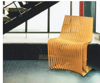
圖1 「43」竹片椅

年年初，易計畫不但已經發表了九項竹材產品（圖2），並積極參與國際展覽，由國立台灣工藝研究所率團，於2008年9月赴法參加「Maison & Objet 巴黎國際家飾展」，讓台灣設計揚名國際（曾國華，2008）。