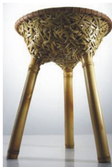
圖 6 Bamboo1

由周育潤設計、陳高明與蘇素任編織的花費兩個星期以上編織完成的竹椅-「BAMBOOL」（圖 6），在展出的一萬多件展品當中，獲得法國當地媒體《avantages》選為「最令人心動的作品」，甚至還有媒體評論該作品「美得令人心碎」，許多國際買家搶著下訂單，搶到缺貨，讓台灣設計揚名國際，成為另類的台灣之光（曾國華，2008）。