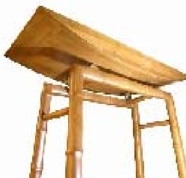
圖 5 日出

藝純熟的日本人驚艷，對竹材玩出心得的張文信與南投大禾竹藝工坊合作，設計與工藝的完美結合，生出這張獲獎無數的竹桌，選用台灣特優竹種孟宗竹十銅件，其中精湛的加工技法，使竹材表面光亮平滑如絲綢，運用大禾竹藝坊擅長的層積竹打造出少見的弧形桌背，桌腳則顛覆竹管的型態，將給人粗糙感的竹粗工材質竹管，利用嚴謹的直角處理，增添現代感與精緻度（吳昭怡等，2006）。