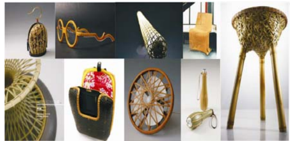
圖2 易計畫發表之九項竹材產品